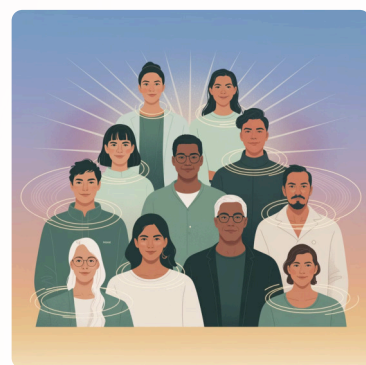
Campo Collettivo: Guarigione e Risveglio attraverso la Coscienza Condivisa