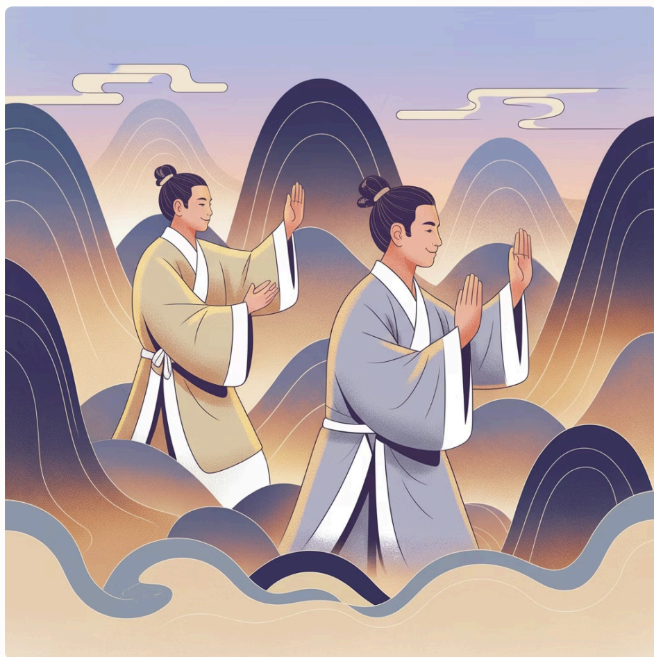
Antiche Radici: 5000 Anni di Tradizione Qigong

La teoria e i metodi Mingjue sono gli insegnamenti più recenti e di più alto livello nella stirpe del Zhineng Qigong, una pratica di coscienza incarnata. Con radici di 5000 anni, la pratica del Qigong è stata rivitalizzata attraverso la scienza quantistica e la medicina integrativa. Il corso include le teorie più recenti e all'avanguardia della scienza del Qigong, della guarigione quantistica e del potere del campo di coscienza collettiva per guarire e risvegliare individui e comunità.